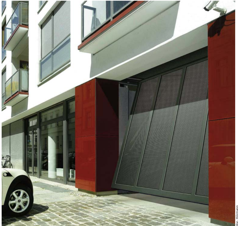
Les nouvelles portes ET 500 qui se déclinent dans une infinité de versions et de matériaux, assorties de motorisations fiables, se destinent particulièrement à l'habitat collectif.

Pour preuve, la gamme de portes ET 500, conjuguée à la motorisation Supramatic H ou ITO 400 constitue une solution idéale pour les collectivités. En effet, à la solution complète et économique des portes ET 500, à l'esthétique particulièrement réussie et aux performances attestées dans le temps, s'ajoute une fonctionnalité exemplaire : une sécurité optimale accompagnée d'un silence de fonctionnement très appréciable, même à basse fréquence... Présentation d'une gamme dédiée aux collectivités et copropriétés.