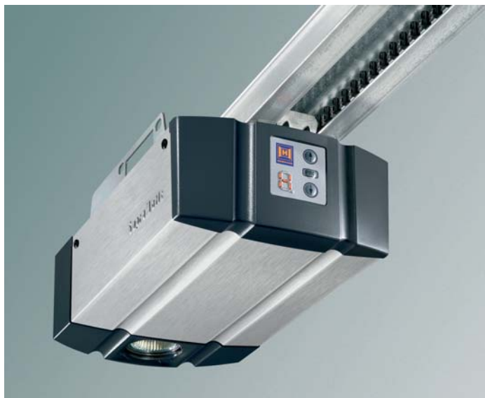
La motorisation SupraMatic H Hörmann : vitesse d'ouverture, sécurité élevée à l'honneur.