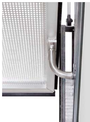
Praticité et fonctionnalité avec le portillon incorporé (en option) aux portes ET 500, avec montage gauche ou droite.